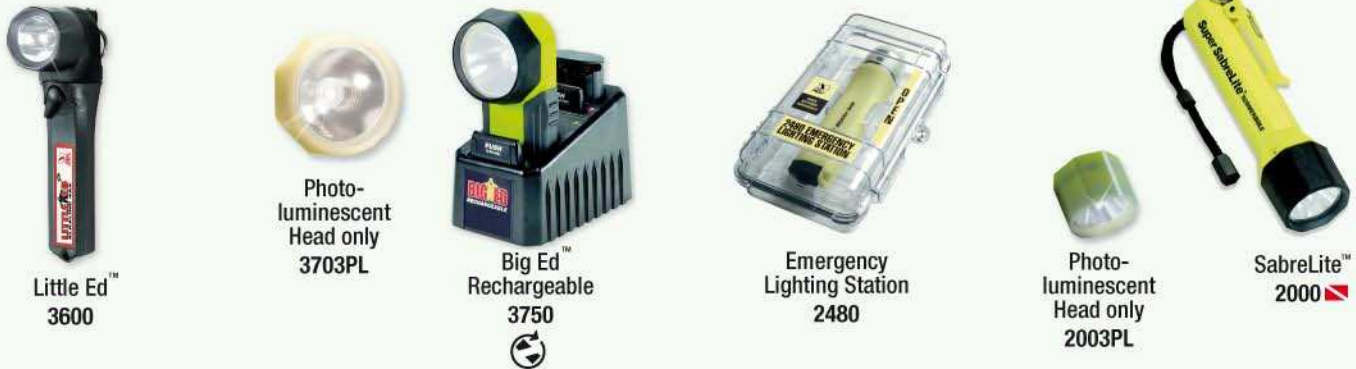
Little Ed™ 3600 Photo-luminescent Head only 3703PL Big Ed™ Rechargeable 3750 Emergency Lighting Station 2480 Photo-luminescent Head only 2003PL SabreLite™ 2000