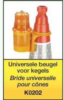
Universele beugel voor kegels Bride universelle pour cônes K0202

Andere modellen op aanvraag / Autres modelles sur demande