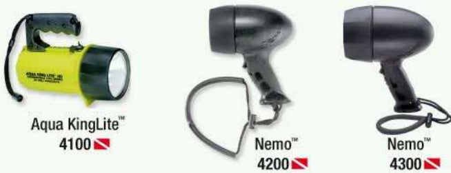
Aqua KingLite™ 4100 Nemo™ 4200 Nemo™ 4300