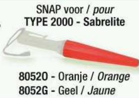
SNAP voor / pour TYPE 2000 - SabreLite 80520 - Oranje / Orange 8052G - Geel / Jaune