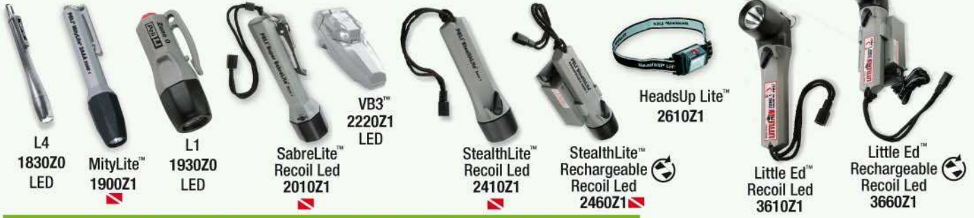
L4 1830ZO LED MityLite™ 1900Z1 L1 1930ZO LED SabreLite™ Recoil Led 2010Z1 VB3™ 2220Z1 LED StealthLite™ Recoil Led 2410Z1 StealthLite™ Rechargeable Recoil Led 2460Z1 HeadsUp Lite™ 2610Z1 Little Ed™ Recoil Led 3610Z1 Little Ed™ Rechargeable Recoil Led 3660Z1