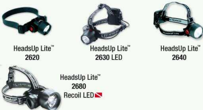
HeadsUp Lite™ 2620 HeadsUp Lite™ 2630 LED HeadsUp Lite™ 2640 HeadsUp Lite™ 2680 Recoil LED