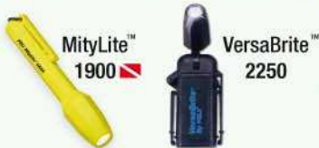
MityLite™ 1900 VersaBrite™ 2250